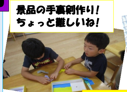
景品の手裏剣作り! ちょっと難しいね!