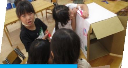
箱に絵を描いてるよ!