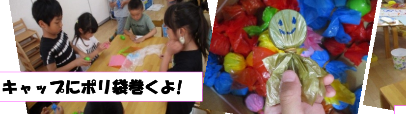
てるてる坊主がいるよ(笑)