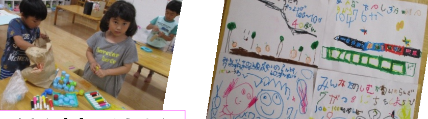
たくさん出来てきたよ☆