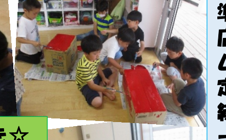
射的の台作り!真っ赤!