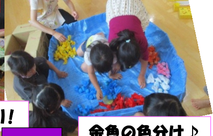
たくさん出来てきたよ☆