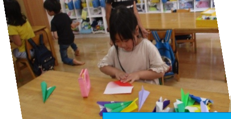
たくさん紙飛行機作るね+