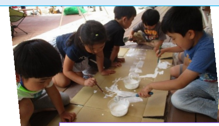
入口の看板「みなたのしむかめいのらんど」も完成!お客さんが来てくれるの楽しみだね☆

「みなたのしむかめいのらんど」に向けて少しずつ準備を進めている中、子ども祭り(園の行事)への出店が決まりました☆6グループで温泉や食べ物、ゲーム等の制作を行っていましたが一時中断をし、出店予定の射的、くじ引き、金魚すくい、紙飛行機飛ばしに絞り、6月から準備が始まりました(*~*)準備のグループは、分けず毎回コーナーを作ってあげると「私これやりたい」、「この前の続きしよう」等と言い、その日によってメンバーも変わり、各自楽しみながら制作、準備を行っていました。又、「僕は、毛糸を切るから〇〇くんは、看板に貼ってね」等と役割を分担したり、相談しながら協力をして進める姿も見られました(^-)-☆子ども祭りをすこく楽しみに準備を進めるかぶとさんでした(*~*)最終準備日は、16名の登園でしたが案内状を持って各クラスを回りました。