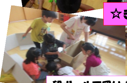
キャップにポリ袋巻くよ!