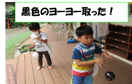
黒色のヨーヨー取った!