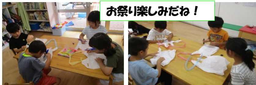
お祭り楽しみだね!