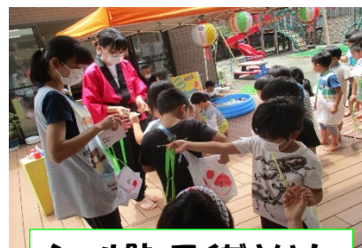
シール貼ってください!