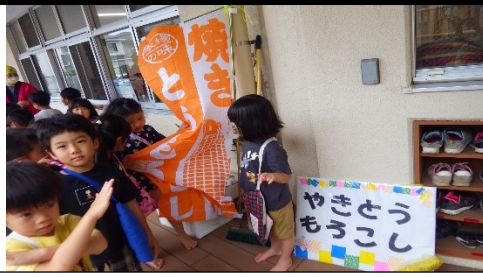
6(火) 焼とうもろこし