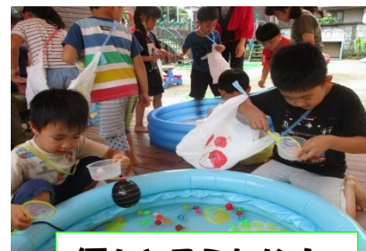
何をとりようかな!