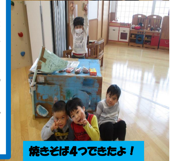
焼きそば4つできたよ！