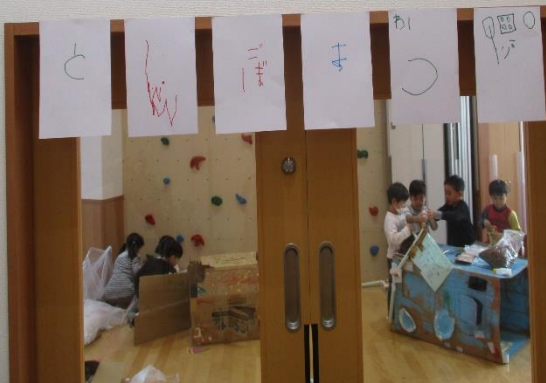
お客さんにわかるように！