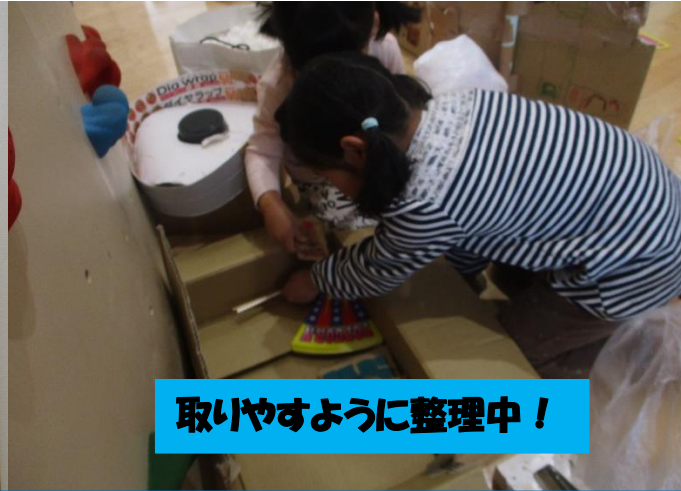
取りやすように整理中！