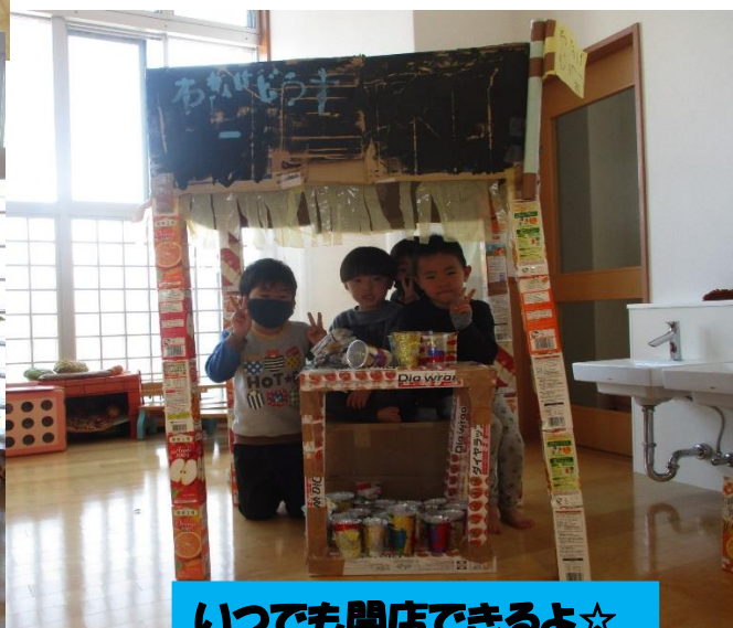
いつでも開店できるよ☆