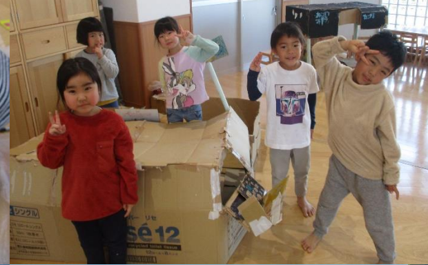
無事に屋根まで付けられたよ！