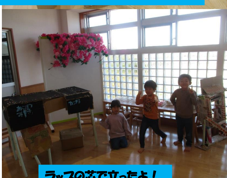
ラッパの芯で立ったよ！