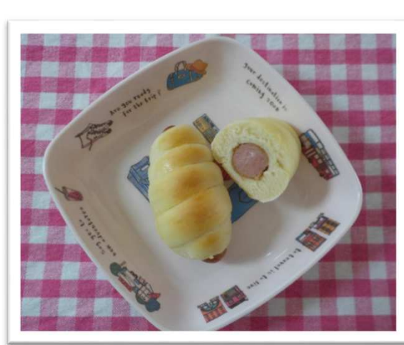
ウインナーロールパン