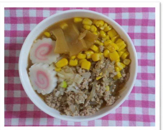
みそバターコーンラーメン