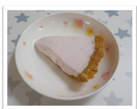
フルーチェムースタルト