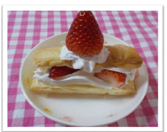
ミルフィーユパイ