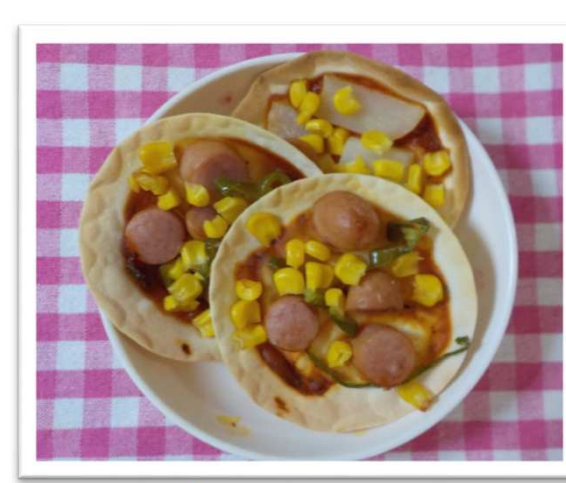
餃子deピザ(オリジナル)