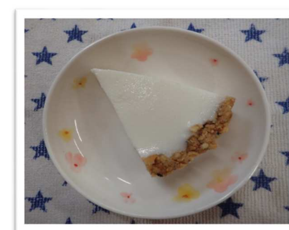
パバロアタルト(ヨーグルト)