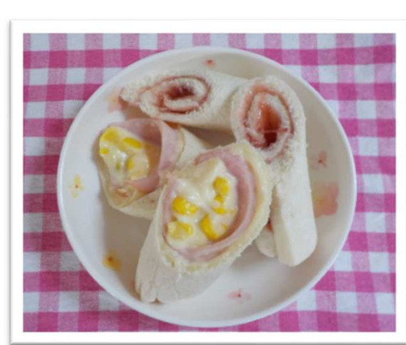
ホットロールサンド