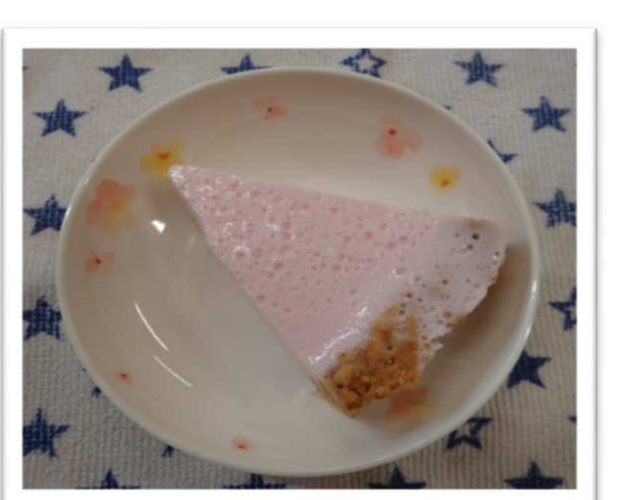
パバロアタルト(いちご)