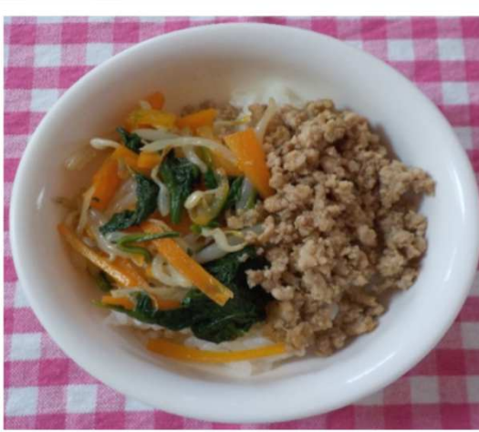
ビビンバ ぶ 風