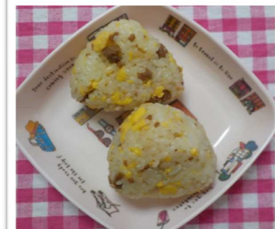
おにぎり いろ (2色そぼろ)