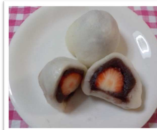
いちご大福 だいふく