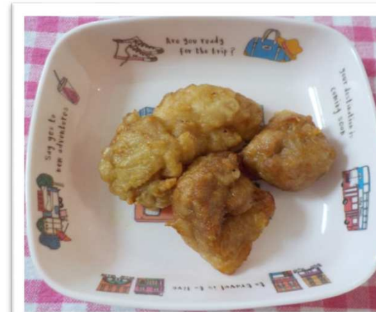
鶏 とり のからあげ