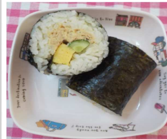
⑤0 えぼろま 恵方巻き