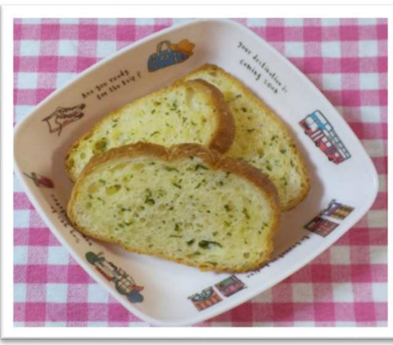
③⑨ ガーリックラスク