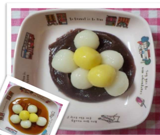
④⑱ つきみ だんご 月見団子