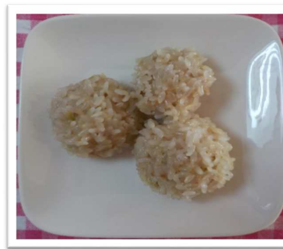
④⑬ ごめ もち米しゅうまい