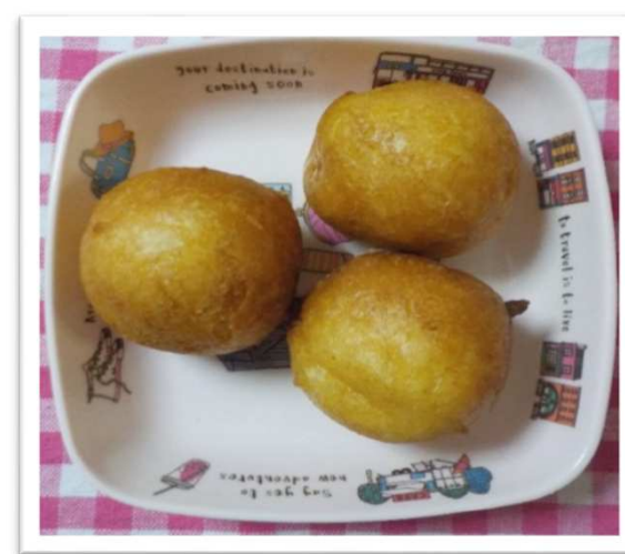
③⑥ りんごのころころドーナツ