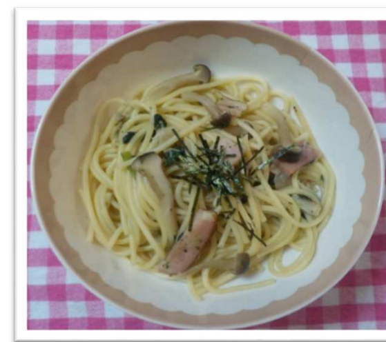
④⑫ わふう 和風スパゲッティー