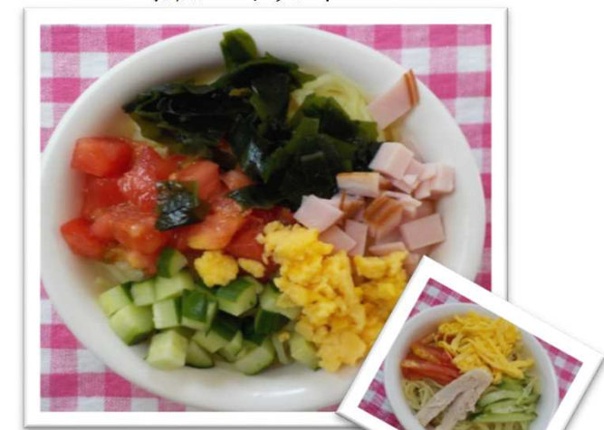
④⑯ ひ 冷やし中華