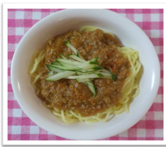
③⑤ ジャーチャー めん 麵