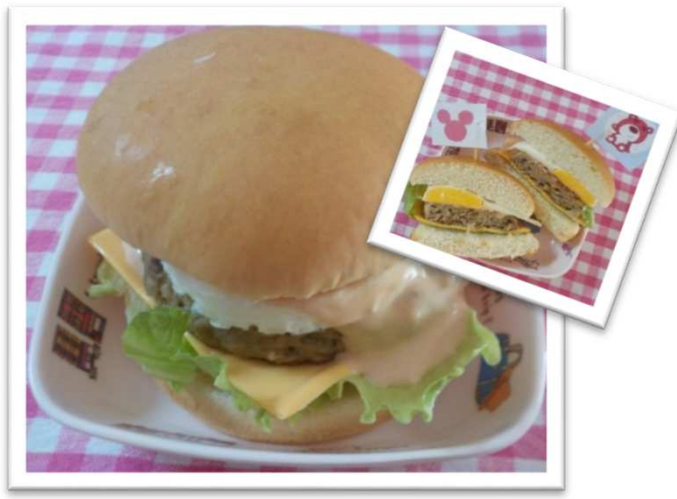
③④ つきみ 月見バーガー